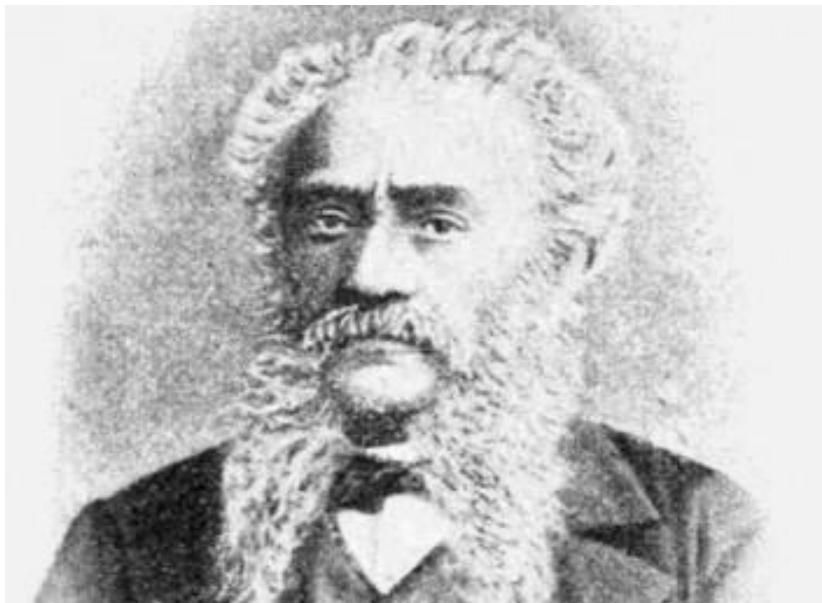
Εικόνα 2. Σπυρίδων Ξύνδας.